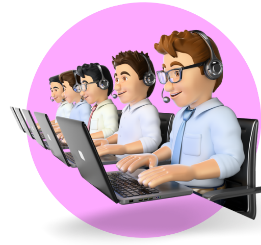
ODP DATA ANALYTIC