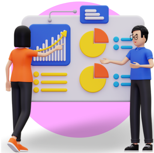
ODP GENERAL BANKING